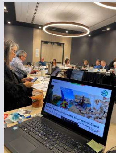
Photo de la réunion du conseil d'administration de l'automne 2022 à la Première Nation Dakota de Whitecap.

Le CNDÉA a rejoint le Centre pour le Nord (CFN) et le Conseil des relations entreprises-autochtones (CIRC) du Conference Board du Canada en tant que membre participant consultatif autochtone. Les perspectives et les connaissances uniques aux membres du CNDÉA enrichiront grandement ces discussions et initiatives, contribuant à une recherche améliorée.